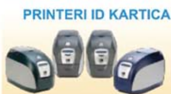
PRINTERI ID KARTICA