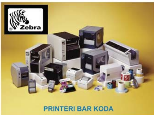
PRINTERI BAR KODA